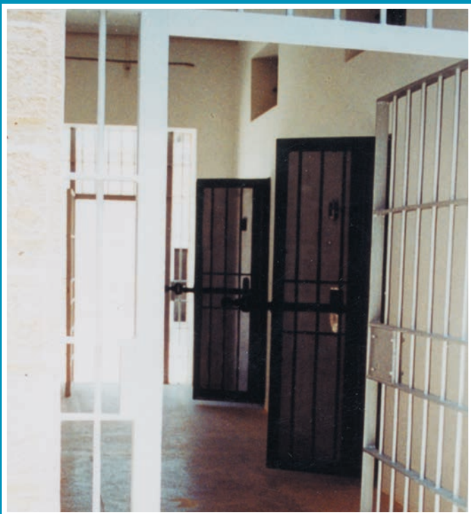
Камеры смертников (блок 8).